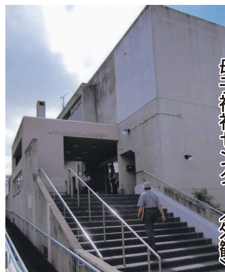
母子福祉センター「外観」